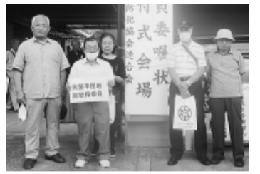
防犯指導員委嘱式の様子

はともかく月一回のペースで夜毎巡回しました。幸い巡回中の事故もなく皆様方平和に暮らして