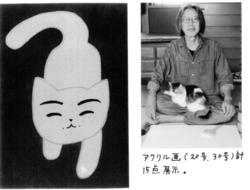
アクリル画(20号、30号)計15点展示。

展示場所 葛飾 寅さん記念館 無料休館所 (入場無料) 2023年 12月28日(木)~1月14日(日) AM9:00~PM4:30 2024年 1月5日(金)~1月10日(水)会場にありません。他の日は、ごめんなさい。おまっしめてます。