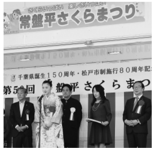
さくらプリンセスの神戸さくら呼さん