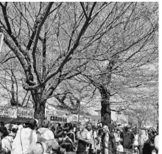
開花にはあと一歩