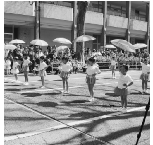
イベントでは子どもたちが大活躍