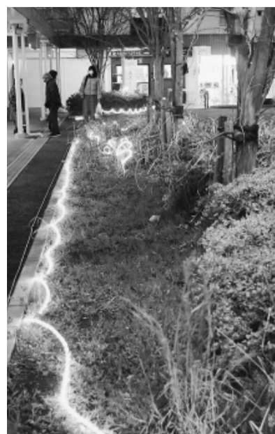
望のひろばの足下を 太陽光の電力で照らす

3月23日(土)17時より、中央商店街望のひろばで「SDGSミニイルミネーションイベント」が開催されました。 これは、常盤平団地を中心に展開されている「SDGS未来都市・自治体SDGSモデル事業」の一環で行われたものです。 このモデル事業では、「7世代」と呼ばれる大